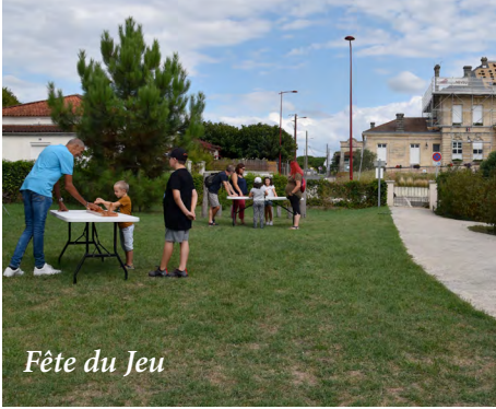
Fête du Jeu