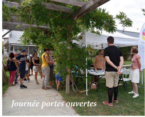
Journée portes ouvertes