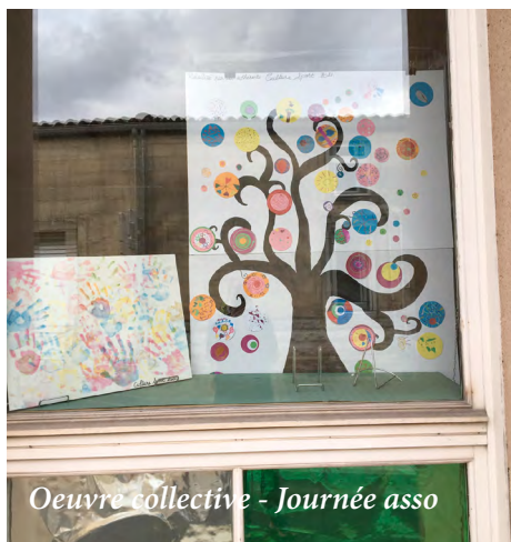
Oeuvre collective - Journée asso