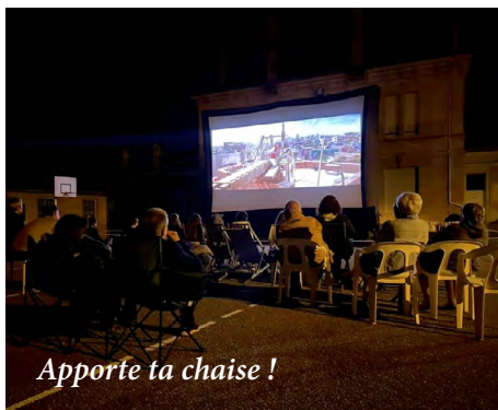
Apporte ta chaise !