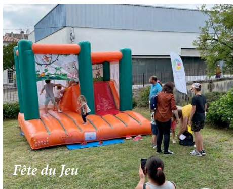
Fête du Jeu