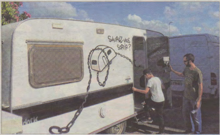
Les jeunes ont joué à un escape game dans la caravane