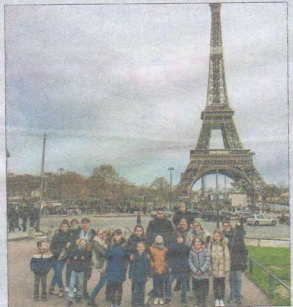
Les jeunes de Culture Sport ont visité Paris

SAINT-SAVIN. Dans le cadre de son école des découvertes artistiques et culturelles (Édac) et des sorties découvertes, l'association Culture Sport a emmené un groupe de 25 personnes à Paris visiter l'exposition Van Gogh, la nuit étoilée, à l'Atelier des Lumières