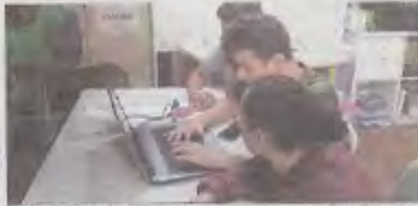
Les jeunes en action

Dix jeunes de l'association Culture sport ont décidé de partir à Montalivet. Ils organisent eux-mêmes leur voyage. Rencontre